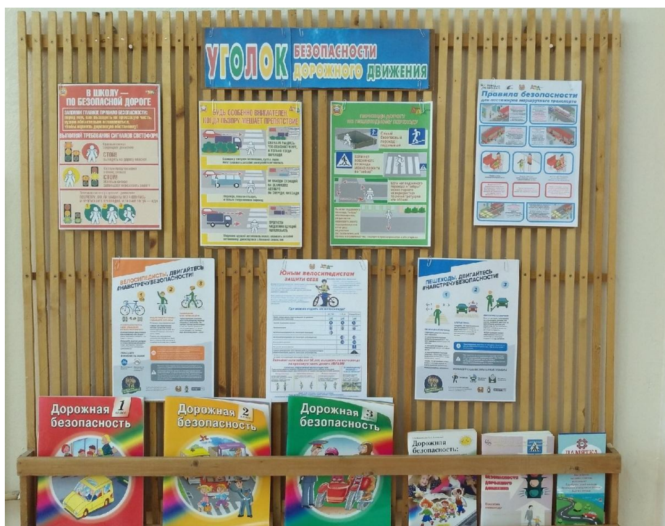
Уголок дорожной безопасности в кабинете английского языка