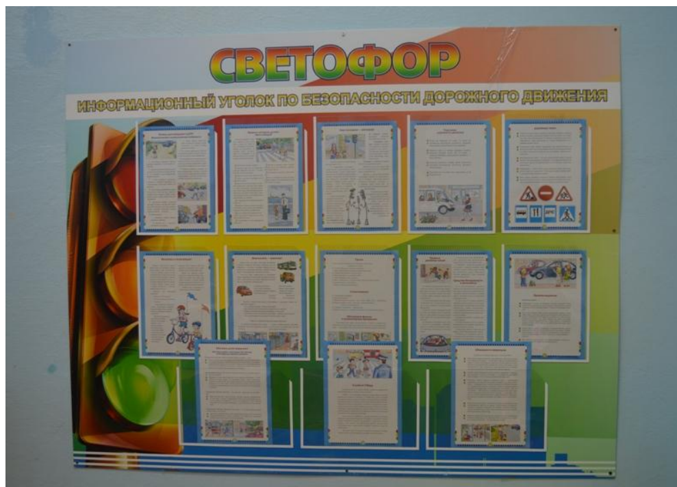
Уголок дорожной безопасности в игровой комнате (дошкольная группа)